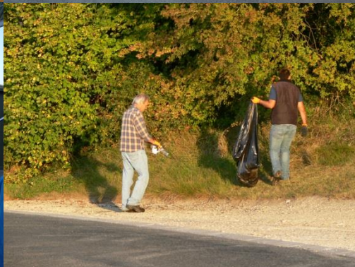
L'opération « Coteaux propres » en 2014