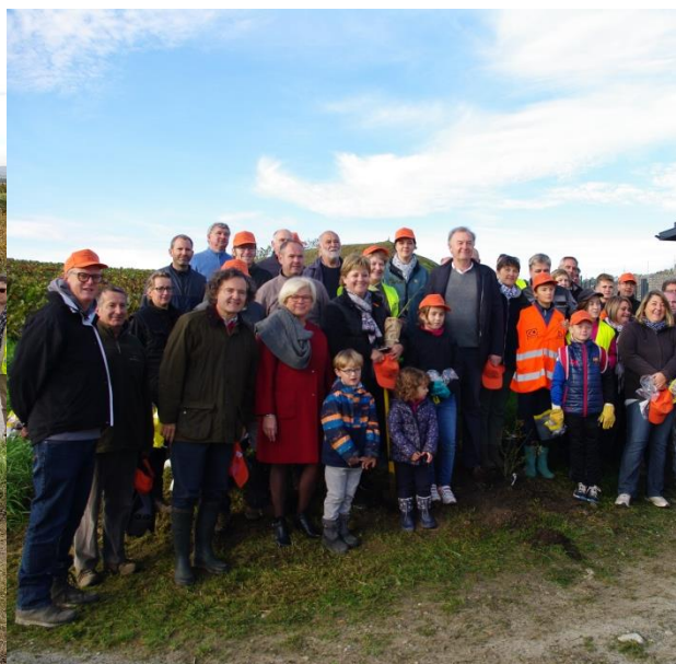
L'opération « Villages et Coteaux propres » et plantation des premiers rosiers